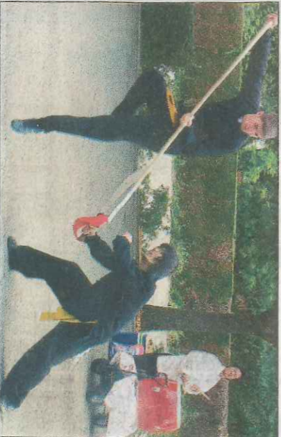
L'association propose d'accéder à une bonne pratique du Kung-fu par un enseignement complet de la technique : histoire et culture sont indissociables du geste.

Les occidentaux connaissent désormais le Tai-chi-chuan, cette forme de gymnastique, douce et lente, pour l'avoir vue dans des reportages. « En Tai-chi, on ne valorise pas la force, mais la position du corps. Le Chi, c'est l'énergie de la vie. En pratiquant, on stimule cette énergie dans tout le corps » explique le jeune professeur. Cette discipline est particulièrement adaptée aux seniors soucieux de préserver leur santé. C'est un art martial dit "interne", qui utilise à la fois souplesse et dynamique. « L'association Dragons Fées enseigne le Tai-chi Tang-