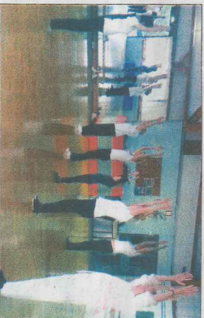
La pratique du Tai-chi privilégie la souplesse. Tout en douceur, elle est accessible à tous, et convient aux seniors.

Il est donc possible d'arriver à la maîtrise par une voie souple. L'autre approche, plus vive, utilise force et vitesse. C'est le Kung-fu, qui ici n'est pas enseigné sous sa forme moderne, très spectaculaire, mais de façon traditionnelle. « Comme pour le Tai-chi, il y a un travail sur les positions et axes du corps, car il est nécessaire de connaître les bases avant de participer à des combats. Savoir accepter une assez longue progression dans l'apprentissage est indispensable, sinon c'est que l'élève n'a pas compris la philosophie de la discipline. » Et l'on comprend dès lors pourquoi l'enseignement des arts martiaux doit s'accompagner d'ouverture culturelle... Organisée selon la circularité, la pensée asiatique se place dans une approche du monde où les éléments se complètent les uns les autres. Rechercher le mieux-être